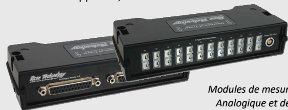
Modules de mesures Analogique et de Thermocouples

En mode CAN bus les enregistreur DL1 ou DL2 peuvent également acquérir les données des IMU06 conjointement à celles d'autres appareils, voire celles de l'ECU du véhicule.